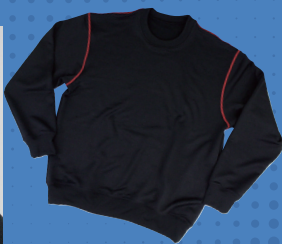
スエットシャツ ステッチオプション + ¥500 (税別)