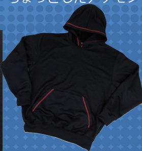
フーデットシャツ ステッチオプション + ¥500 (税別)