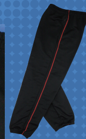
スエットパンツ ステッチオプション + ¥500 (税別)