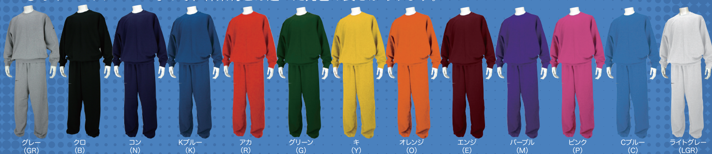
グレー (GR) クロ (B) コン (N) Kブルー (K) アカ (R) グリーン (G) キ (Y) オレンジ (O) エンジ (E) パープル (M) ピンク (P) Cブルー (C) ライトグレー (LGR)